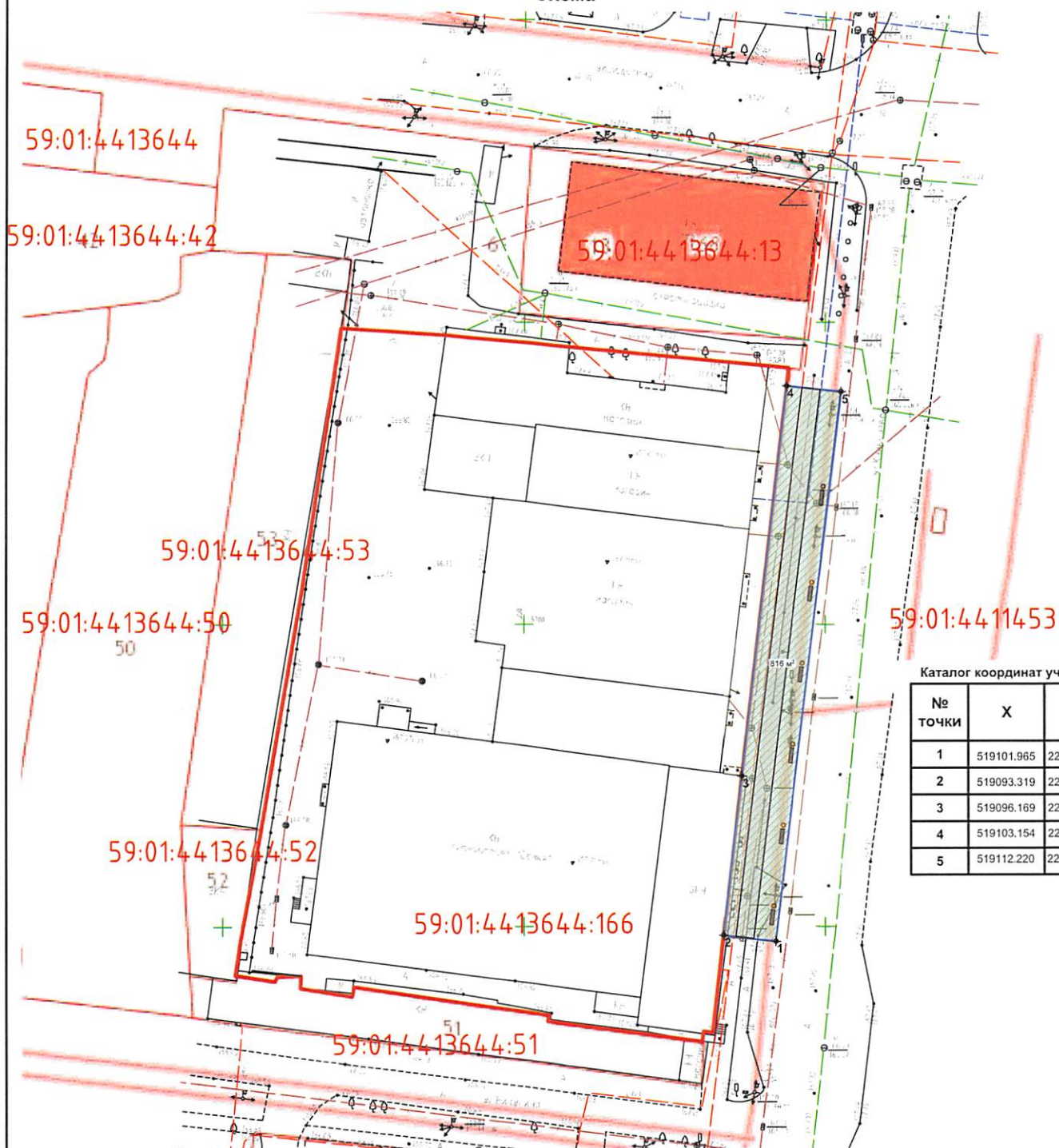
Каталог координат участка, м